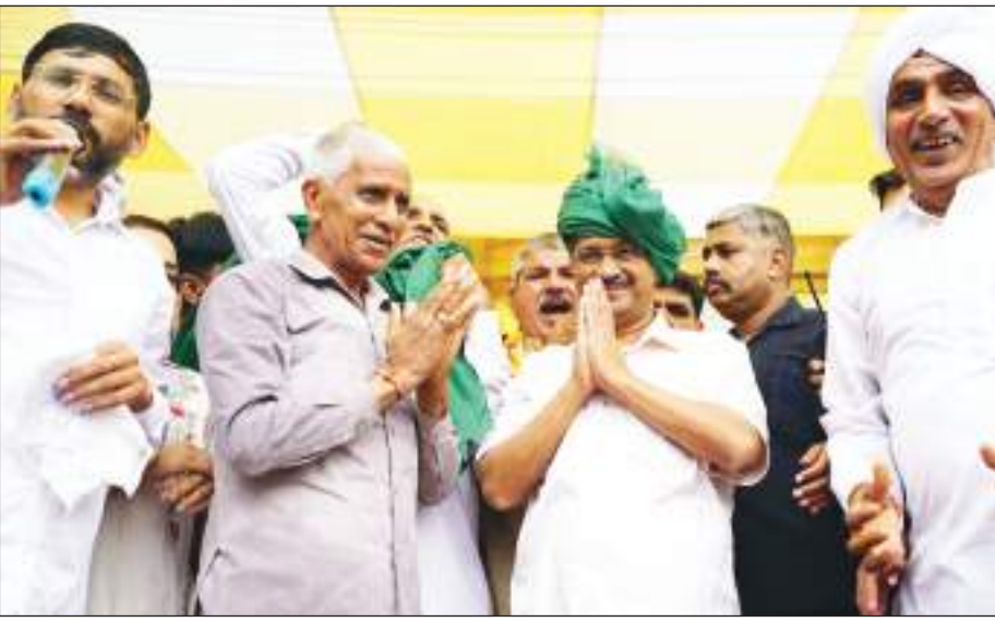
सीएम अरविंद केजरीवाल ने कटेवरा गाँव में जाकर गाँव के लोगों से मिले। इस अवसर पर सीएम ने कहा कि गाँव का फिर्नी रोड़ हमने बनवा दिया है, चौपाल घर समेत अन्य काम भी जल्द करवाएँगे।

नगर निगम के पास अभी केवल 12 टुक हैं। बैठक में निर्णय लिया गया कि बेसहारा गावों को गौशाला तक पहुंचाने में इस्तेमाल करने के लिए 16 और टुक खरीदे जाएंगे। इन 16 टुक के आने के बाद एमसीडी के पास कुल 28 टुक हो जाएंगे। समीक्षा बैठक के दौरान अधिकारियों ने बताया कि वर्तमान में दिल्ली सरकार की चार गौशालाएं चल रही हैं। इस पर केजरीवाल ने दिल्ली में एक और गौशाला बनाने का निर्णय लिया है। मुख्यमंत्री ने एमसीडी के अधिकारियों को जल्द से जल्द नई गौशाला बनाने का पूरा प्लान तैयार करके देने का निर्देश दिया है। दिल्ली में एक और गौशाला बन जाने के बाद कुल पांच गौशालाएं हो जाएंगी, जहां बेसहारा गावों का रख-रखाव बेहतर तरीके से हो सकेगा।