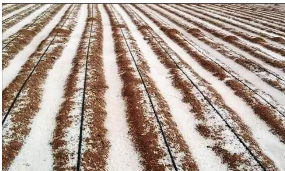
देश के विभिन्न क्षेत्रों में अतिवृष्टि और ओलावृष्टि का असर किसानों पर पड़ रहा है। खेतों में ओले गिरने के बाद सफेद चादर बिछ गई है।

ठीक किया है। आज उत्तर प्रदेश का छह लाख 90 हजार करोड़ का बजट हो पहुंच गया है। नाईक ने उप्र में राज्यपाल के रूप में बिताए अपने कार्यकाल के अनुभवों को साझा किया। उन्होंने कहा कि हमने राज्यपाल शब्द से पहले महामहिम के प्रयोग को रोकने का आग्रह किया। राजभवन का दरवाजा आम जन के लिए खोला था। महाराष्ट्र में यूपी दिवस मनाया जाता था लेकिन राज्यपाल बनकर उत्तर प्रदेश आया तो पता चला कि यहां की सरकार उप्र का स्थापना दिवस नहीं मनाती। यह आश्चर्यजनक था। मैंने तत्कालीन मुख्यमंत्री अखिलेश यादव से आग्रह किया। उन्होंने नहीं माना। भाजपा सरकार आने पर मुख्यमंत्री योगी से आग्रह किया। उन्होंने माना और अब प्रदेश में उसका स्थापना दिवस मनाया जाता है।